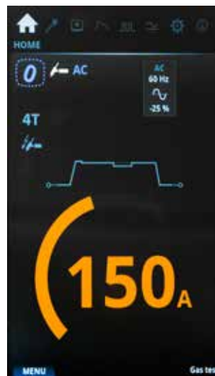
MTP35X (ajustement standard sur MT535)