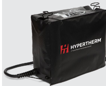
Housses de protection contre la poussière pour le système