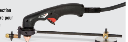
Guides de coupage circulaire