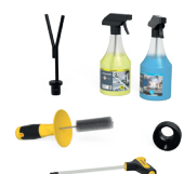
FOR FREE 1x 283999

Nos prix s'entendent hors taxes, transport et emballage en sus. Tous les prix en CHF (francs suisses). Paiement 30 jours net. Sous réserve de modifications techniques. Franco notre dépôt. Réserve à la revente. Nos conditions générales de vente s'appliquent. Sous réserve de modifications de prix et d'erreurs d'impression.