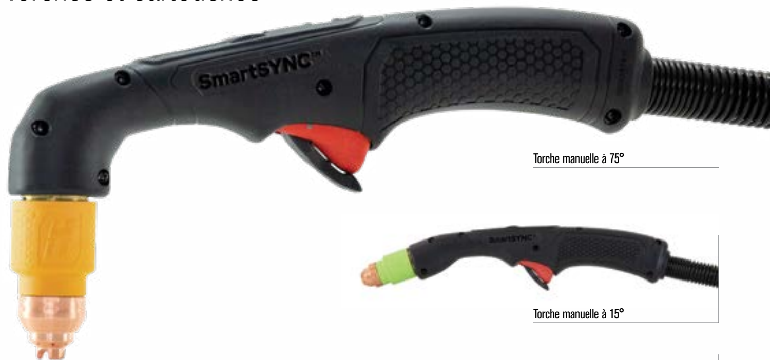
Torche manuelle à 75°