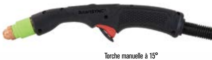
Torche manuelle à 15°